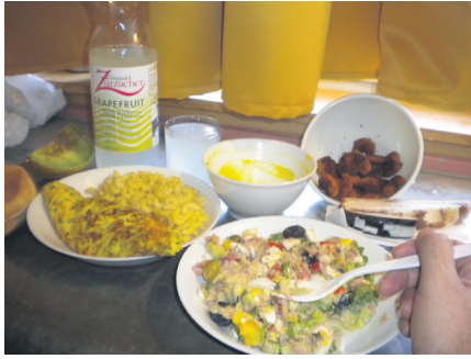
9 Je m'apprête à dîner dans la solitude avec ce petit repas que je me suis préparé.