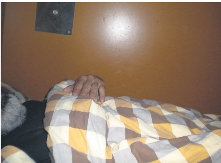
8 Aujourd'hui c'est férié, je me lève un peu tard.