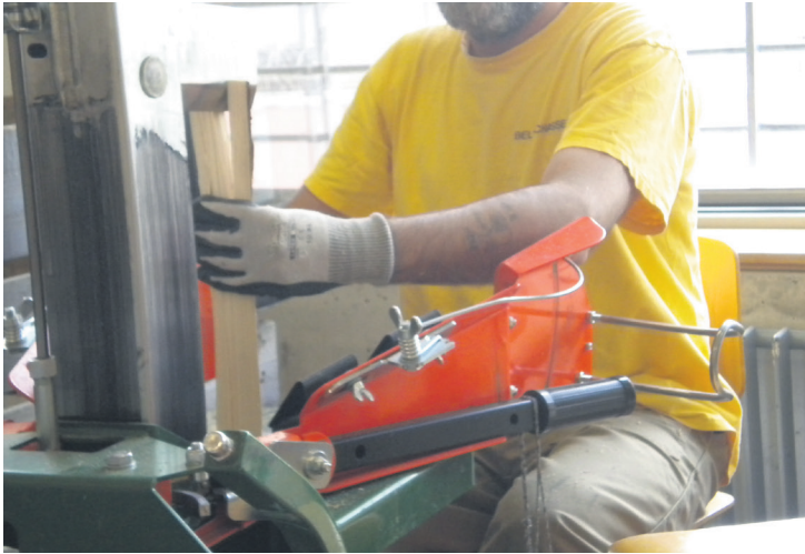
4 Je coupe encore et encore du bois.