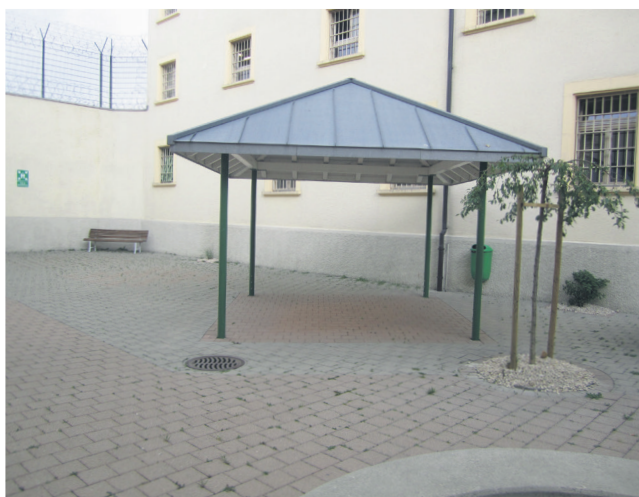
15 Bancs et abri dans la cour: abris, dessous les quels on pourrait installer quelques bancs supplémentaires.