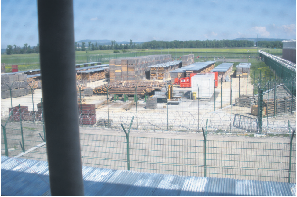
12 Je passe tous les jours à la fenêtre [de l'atelier] à voir les vaches dans les pâturages et les moutons. (traduit du portugais)