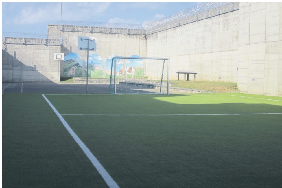
14 Terrain de sport extérieur. Place assise oui, mais aucune place avec ombre. Dommage.