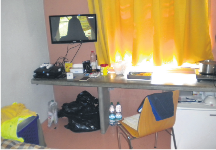
10 Mon côté salon et cuisine.