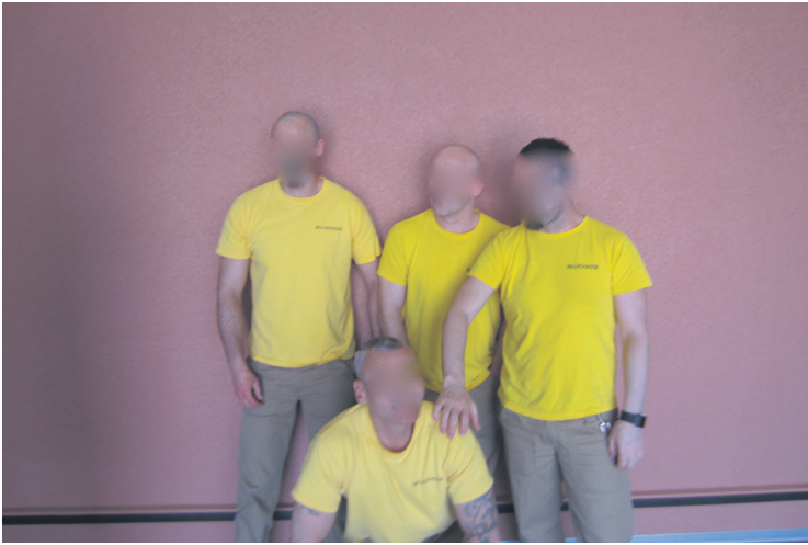
6 Moi avec mes collègues de travail avec qui je passe beaucoup de temps. (traduit du roumain)