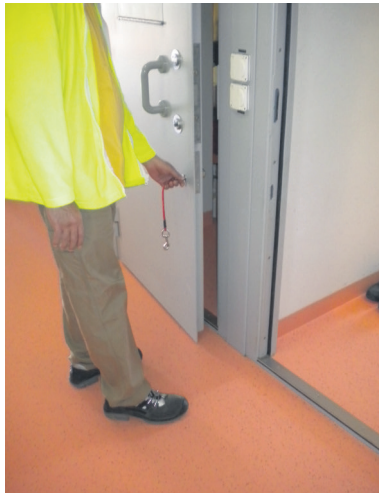
11 Je ferme ma cellule pour partir travailler.