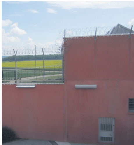
13 Le champ en face de ma chambre. J'aime le regarder. Il m'apaise. (traduit du roumain)