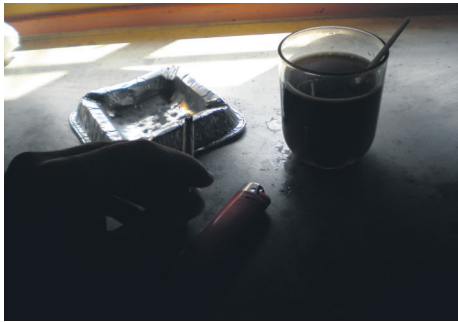
7 Après mon déjeuner je fais une pause.